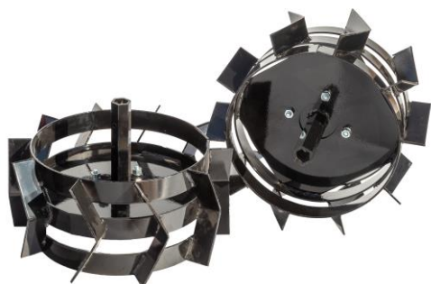
Set roți metalice 350 mm sau 400 mm cu adaptoare de fixare