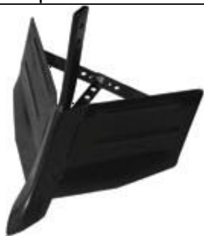
Accesoriu deschis rigole reglabil