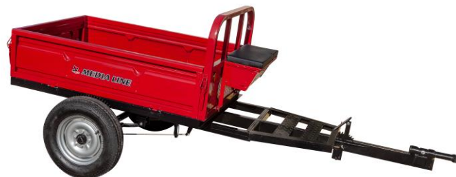
Remorcă 400 kg sau 500 kg